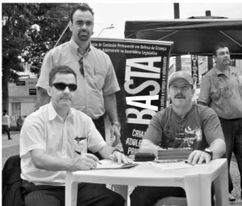
Em defesa da delegacia da criança e do adolescente

O Sindicato dos Bancários de Mogi das Cruzes e Região, junto com outras entidades tais como a Associação de Moradores de Jundiapéba e o Partido dos Trabalhadores (PT-Mogi), estiveram reforçando uma manifestação, realizada em 26 de fevereiro, no Largo do Rosário no Centro de Mogi das Cruzes pela coleta de assinaturas para a criação de uma delegacia especializada em defesa dos direitos das crianças e dos adolescentes. A campanha que está sendo realizada pelo deputado Estadual Donisete Braga (PT-SP) em parceria com Conselheiros Tutelares de todo Estado é para que a Assembléia Legislativa aprove projeto que crie uma Comissão Permanente em Defesa da