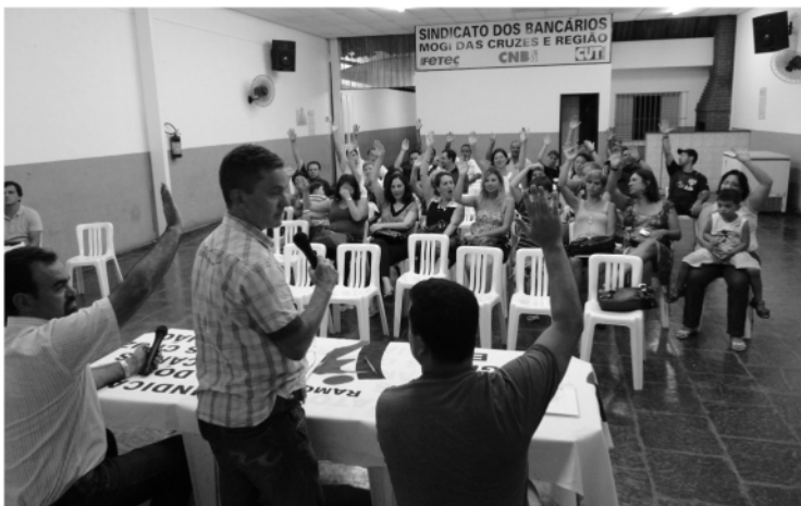
Em votação representantes da categoria aprovaram o balanço anual