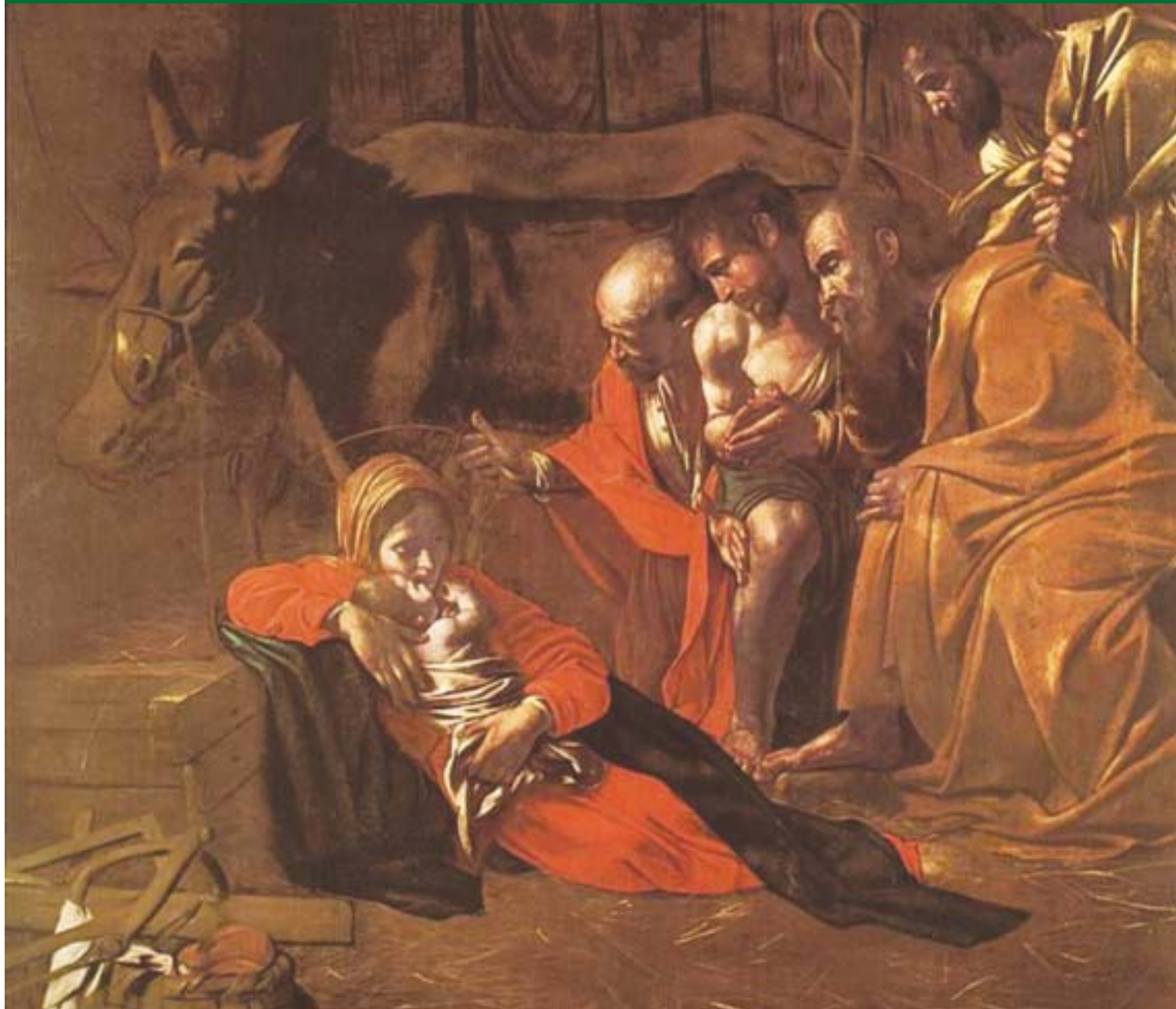
Caravaggio. Adorazione dei pastori. (c. 1608)

Informativo do Sindicato dos Trabalhadores em Empresas do Ramo Financeiro de Mogi das Cruzes e Região